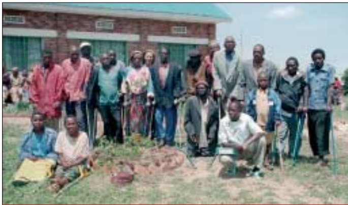
Die ehrenamtlichen Helfer haben viele Menschen mit Behinderungen angetroffen ...