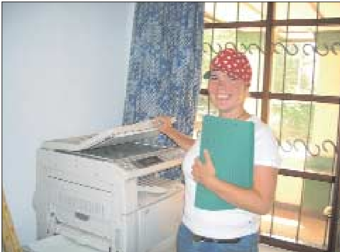
Eine waschechte „Muzungo“!

chen fast alle Menschen französisch. Auf dem Land jedoch, wo nur Wenige Zugang zu einer Schulausbildung haben, stellt die Kommunikation ein Problem dar. Jedes Mal, wenn ich aufs Land an die Schulen fahre, um Schulmaterial – Hefte, Stifte, Lineale oder Kreide, denn es fehlt an allem – zu verteilen, wünsche ich mir, ich könnte mich mit den Kindern unterhalten, sie fragen, was sie gerade lernen oder welchen Beruf sie gerne hätten, falls sie denn eine Wahl hätten. Meistens reicht schon ein Lachen, die leuchtenden Augen, wenn man ihnen ein Heft in die Hand drückt oder