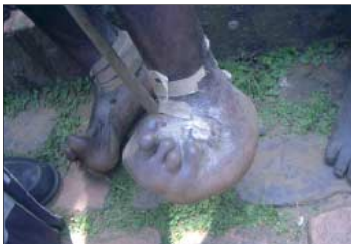
Deformierter Fuß wegen einer unbehandelten Verbrennungswunde.

In Ruanda zählt man etwa 800.000 Menschen mit Behinderungen, sie machen etwa 10 Prozent der Bevölkerung aus.