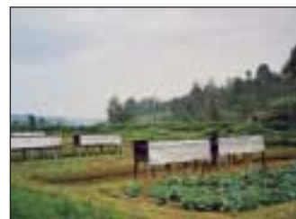
Versuchsstation für integrierte Stoffkreisläufe. Hier werden Hasenzucht, Fischzucht und Feldwirtschaft gekoppelt.

schließung der Marais eine weitere Möglichkeit, um die Ernährungssituation des Landes zu sichern. Diese letzten Landreserven bedecken in etwa 165.000 ha, also 7,5% der Staatsfläche. 57% der Marais sind bereits erschlossen, wobei es sich fast ausschließlich um