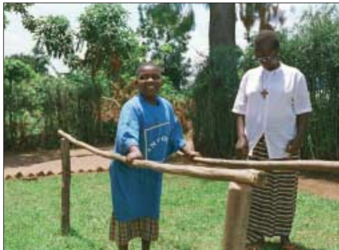
Behinderte Menschen in Ruanda.