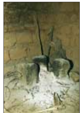
Drei-Steine-Kocher: hoher Holzverbrauch und lungenschädlicher Rauch

5. Lichtversorgung: In Ruanda geht die Sonne pünktlich um ca. 18.30 Uhr unter. Wer dann kein elektrisches Licht