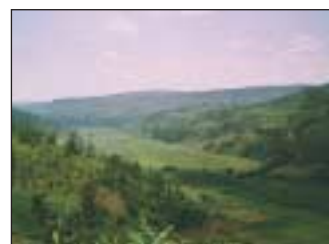
Die Erschließung der kleinen und mittleren Marais ist in weiten Teilen des Landes bereits sehr fortgeschritten und wird von der Regierung als Priorität betrachtet.