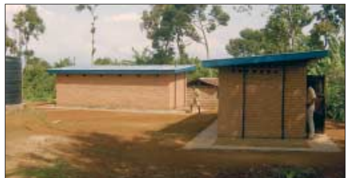
Die neuen Latrinen reichen nun für alle Schüler.