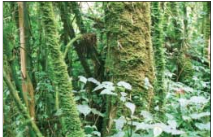
Der Holzeinschlag übersteigt den Nachwuchs bei Weitem.

Jan Altstädter ist Diplom-Geograph und seit August 2005 am IfaS in der Funktion des Projektmanagers für Ruanda tätig.