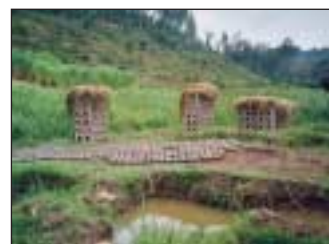
Ziegelsteinherstellung in einem Marais bei Butare. Aus dem im Marais gewonnenen Ton werden Ziegelsteine gebrannt.

Neben der Einfuhr von nachhaltigen Anbaumethoden auf den Hügeln und Hängen (z.B. Agroforst) bietet die Er-