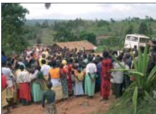
Die Ruander staunten nicht schlecht, als die Deutschen Lieder auf Kinyarwanda sangen!

der Reise, der in uns allen einen tiefen Eindruck hinterlassen hat. Es war schön, im Nationalmuseum in Butare den SängerInnen und TänzerInnen zuzuschauen. Doch noch schöner war es, dass wir ihnen mit unseren Liedern auch etwas geben konnten und dass wir gemeinsam die ruandische Nationalhymne singen konnten.