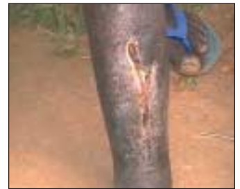
Eine nach außen durchgebrochene, eitrige Knochenmarksinfektion. Sie soll bald operiert werden.