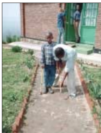
... und für diesen Jungen mit Hüftschaden.