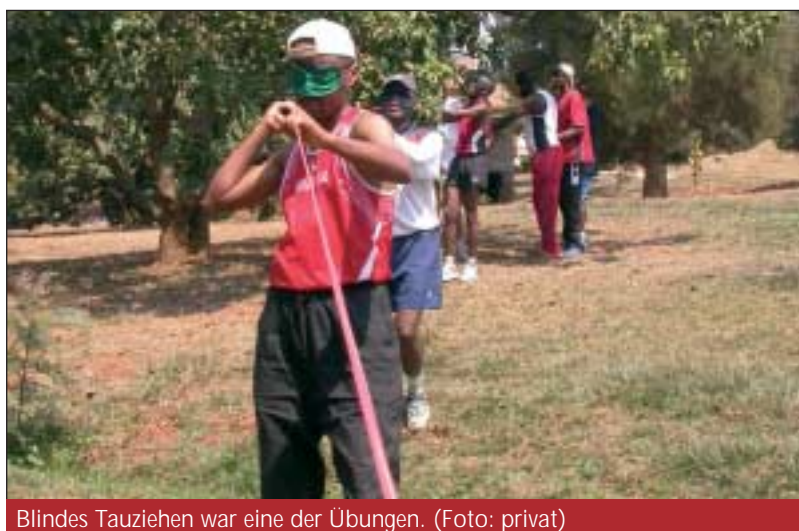
Blindes Tauziehen war eine der Übungen.

Jahren das heute staatliche Haus. Dort sind viele verschiedene Behinderungen vertreten. Viele Kinder mit Missbildungen der Gliedmaßen, Amputationen durch Kriegseinwirkung oder späteres Minentreten, Blindheit und Aids leben hier. Krieg, Not, Elend, Mangelernährung, Unterversorgung in allen Bereichen hinterlassen besonders deutliche Spuren.