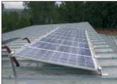
Solaranlage Kamsi

Der hohe Holzverbrauch macht die Beschaffung von Holz zeitraubend, teuer, und hält die Kinder teilweise davon ab, in die Schule gehen zu können.