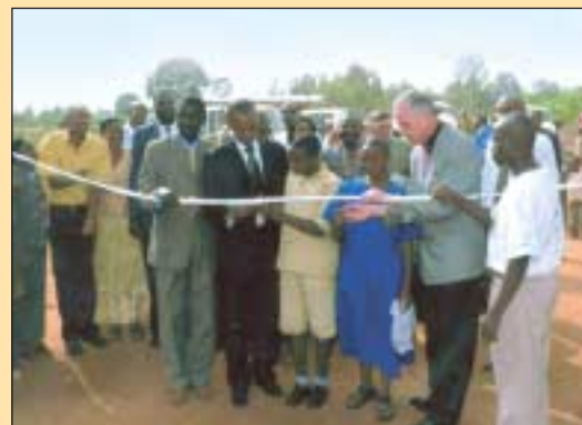
Die Grundschule in Rukoma wird feierlich eröffnet.