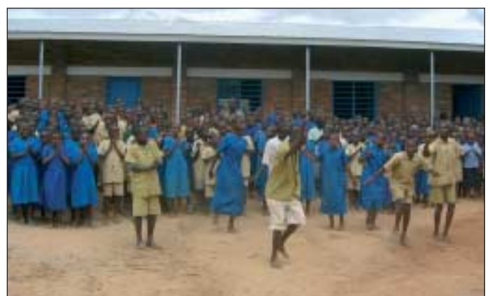
Die Kinder freuen sich über ihre neue Schule!