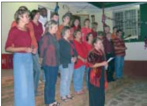
Der Chor SaM aus Daun bei einem seiner Auftritte.