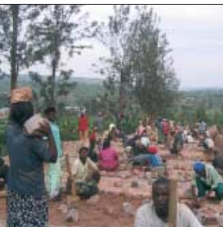
Für die Pflasterarbeiten werden viele Arbeiter benötigt.

Auch das Versetzen der Pflastersteine ist personalintensiv. Selbst wenn der Unterbau der