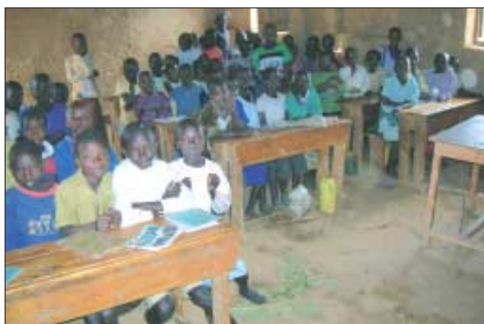
Viele ruandische Primarschulen brauchen dringend neue Klassenräume.

1. Schritt: Stellt ein Schulleiter oder eine Gemeinde fest, dass ihre Schule dringenden Bedarf an mehr Klassenräumen oder auch Latrinen hat, so wenden sie sich mit dem Anliegen an das