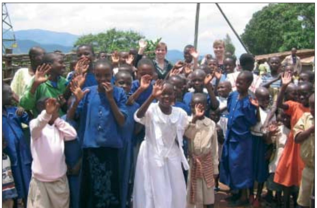
Die Mitarbeiter des Centre Komera wollen den Kindern zu mehr Selbstvertrauen verhelfen.

schen Beistand geboren. Somit wird oft nicht erkannt, wenn das Kind mit einer Krankheit oder Beeinträchtigung zur Welt kommt. In einigen Fällen wird die Einschränkung erst erkannt, wenn das Kind mit vier Jahren immer noch nicht sprechen kann oder in der Schule erhebliche Schwierigkeiten auftreten. Meistens kann es diesen Kindern dann nicht ermöglicht werden, eine Schulausbildung zu genießen, da es zu wenige spezielle Programme oder Projekte für Be-