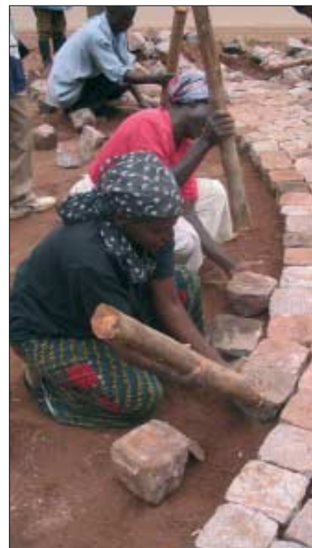
Das Handwerk kann von Frauen und Männern gleichermaßen ausgeübt werden.