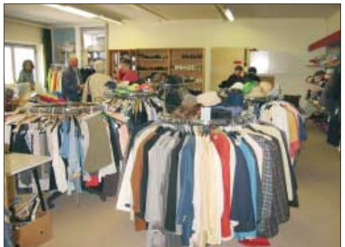
Das große Sortiment ist nur durch die großzügigen Spenden der Landauer möglich.

Die Kunden freuen sich stets auf den Donnerstag. „Für manche sind wir auch Seelentröster geworden. Viele Alleinstehende haben in uns einen Partner gefunden und spre-