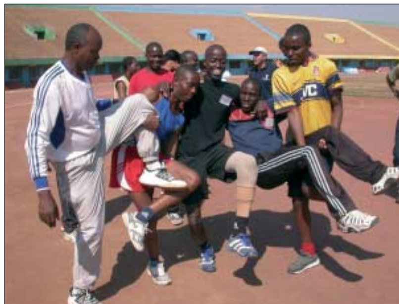
Auch die Übungsleiter hatten viel Spaß am Lehrgang.

Bei einem ersten Abgleich mit den ruandischen Partnern einigte man sich auf Lehrgangsinhalte wie die Didaktik und Methodik des Behindertensports und die Vorbereitung und Planung von Sportunterricht. Weiterhin wurde über Kompetenzen, die ein Übungsleiter haben sollte, vor allem aber auch über die Situation und Bedingungen in Ruanda gesprochen. Schwerpunkt war die Sportpraxis. Im Unterrichtsraum spielten die Teilnehmer Sitzhockey, eine Variation des Hockeyspiels für Rollis oder ältere Menschen. Im Stadion lernten sie das Arbeiten mit verschiedenen Sportgeräten wie Stäben, Seilen und Bällen kennen. Von Beginn des Lehrgangs an stand fest, dass