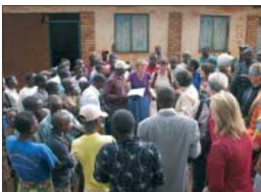
Wo die Dauner auch hinkamen, zogen sie neugierige Blicke auf sich.