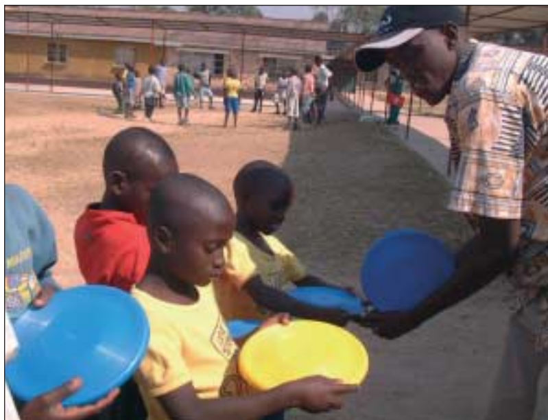
Kritisch begutachteten die Kinder die Frisbee-Scheiben.