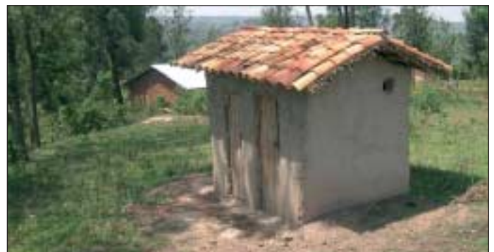
Diese Latrine war früher für ca. 800 Schüler!