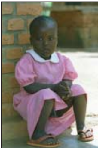
Behinderte Menschen werden in Ruanda oft nicht akzeptiert.

Auch wenn durch Aufklärung einige Erfolge erzielt wurden, so bringen Unkenntnis und Hilflosigkeit der Eltern nach wie vor wahre Tragödien hervor.