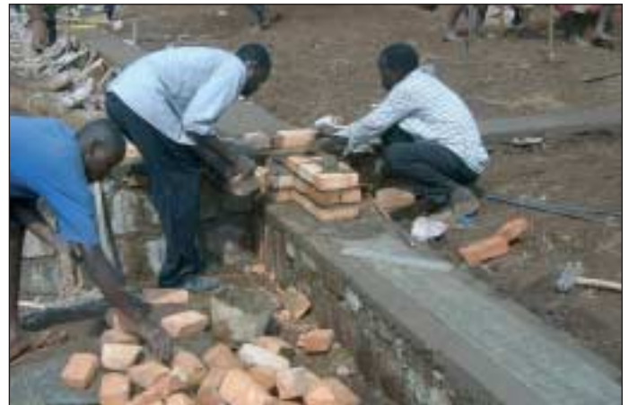
An dem Bau werden möglichst viele Mitglieder aus dem Dorf beteiligt.