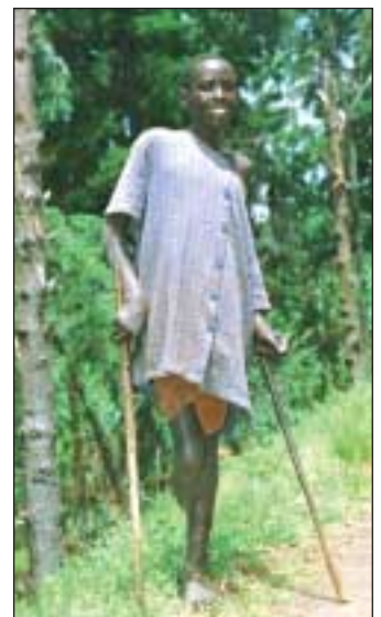
Trotz Behinderung hat dieser Junge sein Lächeln nicht verloren.

Das größte Problem blieb jedoch der fehlende offizielle