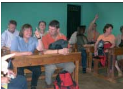
Der Dauner Chor besuchte auch einige seiner Projekte, wie diese Grundschule.