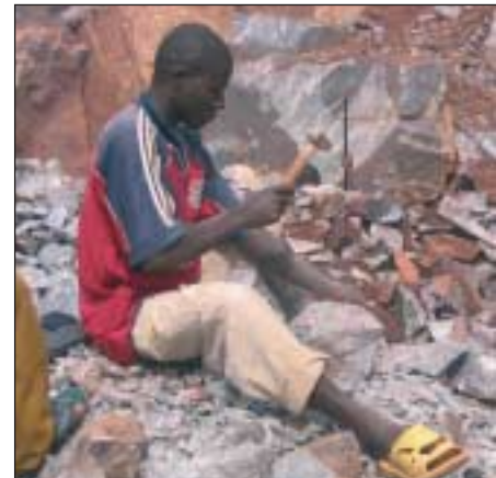
Ein Arbeiter beim Steinbruch.

Ausgehend von den wirtschaftlichen Rahmenbedingungen in Ruanda (hohe Arbeitslosigkeit, geringe Kaufkraft) und aufbauend auf der Tradition und der hohen handwerklichen Qualität des Natursteinmauerwerks, ist die Pflasterertechnik mit Naturstein eine zu empfehlende Bauweise für den Ausbau des Sekundärstraßennetzes. Die notwendigen Materialien sind im Land vorhanden und die große Zahl einzusetzender Arbeitskräfte schafft Beschäftigung. Da unter den Arbeitern vor allem ungelernete und angelernte Kräfte eingesetzt werden können, sind die Arbeiten bestens geeignet für demobilisierte Soldaten, Witwen und andere benachteiligte Bevölkerungsgruppen. Asphaltstraßen stellt zweifellos die höher entwickelte Straßenbautechnik dar, jedoch müssen sie mit hohem Einsatz von Maschinen, importierten Rohstoffen und zum Teil ausländischen Fachleuten gebaut werden. Pflasterstraßen hingegen leisten neben der wirtschaftlichen Entwicklung des Landes einen unmittelbaren Beitrag zur Reduzierung der Armut im Land und unterstützen damit auf zweifache Weise die Entwicklung. ■