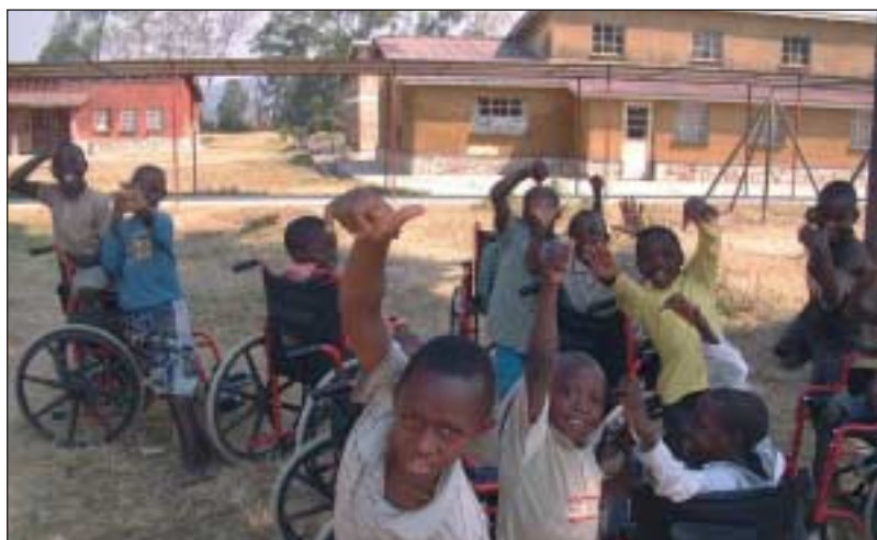
Daumen hoch: Die behinderten Kinder aus dem ruandischen Gatagara erlebten einen außergewöhnlichen Tag.