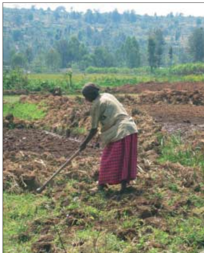
Bäuerin bei der Arbeit im Marais. Bei den Feldarbeiten zeichnen sich die meisten Männer leider durch ihre Abwesenheit aus.

Es sollte aber nicht vergessen werden, dass es sich bei diesen Gebieten häufig um sensible Ökosysteme handelt, die eine vorsichtige und wohlbedachte Erschließung verlangen. Dies hat die ruandische Regierung erkannt und beschlossen, dass jede Nutzung für Land-, Vieh- und Fischwirtschaft oder für die Entnahme von Baumaterial (Ton, Sand) vorheriger biologischer, hydrologischer und sozioökonomischer Untersuchungen und Planungen bedarf. Alle Maraisflächen gehören dem Staat und jeder Bauer muss die Erlaubnis des Président du Conseil de District einholen, bevor er dort wirtschaften darf. Dieses Recht kann ihm jederzeit wieder entzogen werden. Eine schlechte Nutzung dieser Flächen durch unzureichende Kenntnisse der Be- und Entwässerungstechniken kann schnell zu Störungen im Abfluss, zur Beschädigung