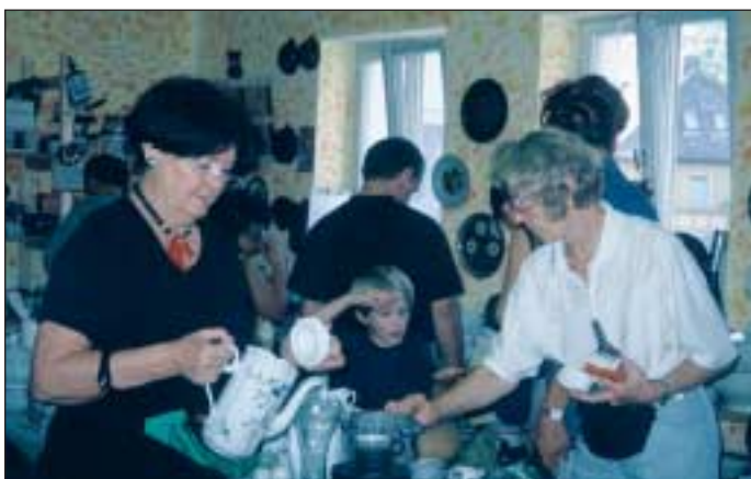
Auf dem großen Flohmarkt ist für jeden etwas dabei.

Für neue Spenden sind die Landauer stets dankbar, die Waren können donnerstags, von 13.30 bis 15 Uhr im Flohmarkt, am Nordring 46 in Landau, abgegeben werden. ■