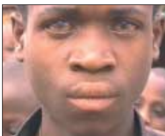
... über Erblindungen ...